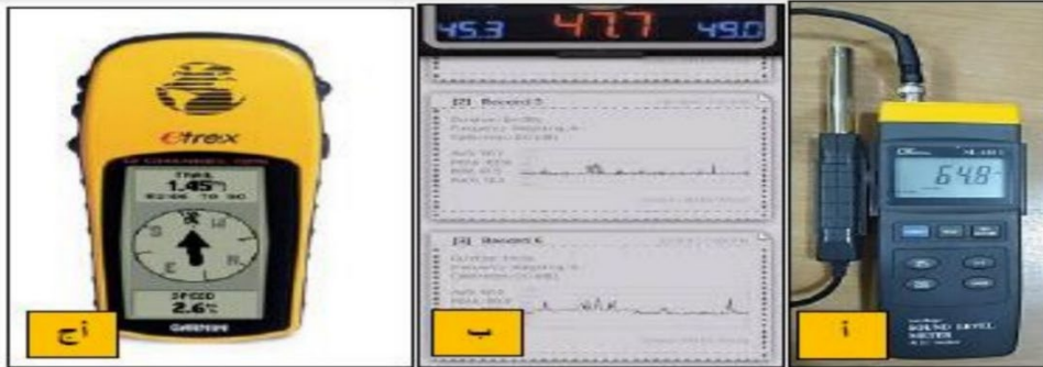
صورة (11) جهاز فحص الضوضاء نوع (SLM4013)

ثالثا : مقترحات تطوير حركة النقل والمرور .